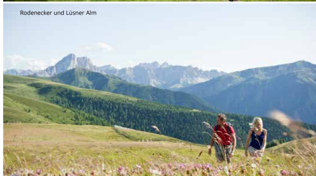
Rodenecker und Lüsner Alm